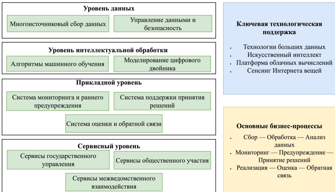
Рисунок 2 – Цифровая платформа управления качеством жизни населения Китая

Архитектура предлагаемой цифровой платформы управления качеством жизни населения представляет собой многоуровневую систему, как показано на рисунке 2.