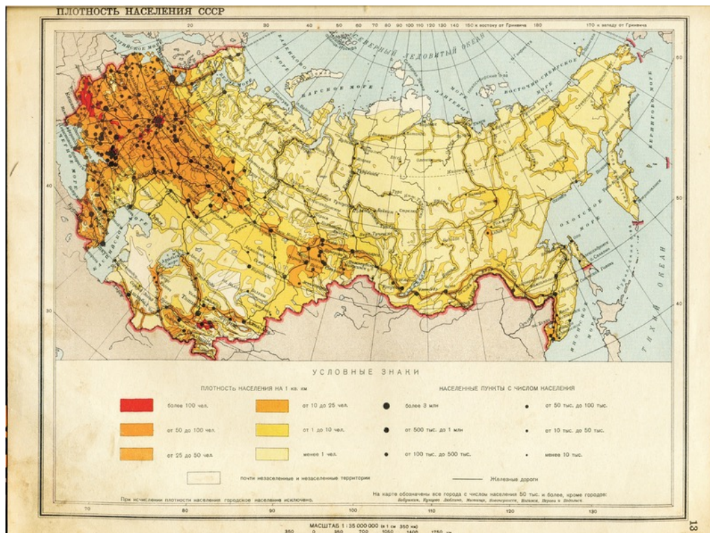
Рисунок 2 – Карта плотности населения СССР

Все проекты, связанные с развитием транспортных систем страны, созданием новых населенных пунктов в труднодоступных территориях и их заселении, несли в себе первоначальные идеи коммунизма, на основе которых и был создан СССР. Единение всех национальностей, а вместе с тем и единение всех земель позволяло достичь максимальных производственных потенциалов страны, наращиванию ее мощи и суверенности. Кара-Мурза С.Г. в книге «Советская цивилизация» резонно подчеркнул эффективность такой экономической направленности: «Нынешнее состояние России – лишь эпизод ..., совмещенный с непрерывной горяче-холодной войной... В этой войне советский проект был для всей фашиствующей мировой расы как кость в горле... Возможно и человечество, устроенное как семья, «симфония» народов...» [9]. Уже с появлением СССР стала вырисовываться четкая, ярко-выраженная, особенная «Советская цивилизация», несравнимая с другими народами и странами. Она же и стала основой для современной Российской цивилизации. Смогла ли страна-преемник великой державы сохранить потенциал?