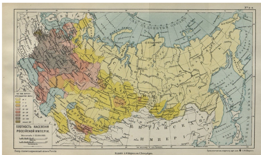
Рисунок 1 - Карта плотности населения Российской империи

Прежде всего необходимо подтвердить гипотезу о мелких коллективных хозяйственных образованиях как о способе приспособления к климатическим и географическим условиям. Наибольший интерес представляет территория Сибири. Так как именно здесь находится огромное количество неиспользованных и неисследованных природных ресурсов, и в то же время наблюдаются суровые климаты. При изучении карты плотности населения Российской империи (Рис. 1) можно наблюдать следующую картину: вся территория Сибири и Дальнего Востока имеет общую плотность населения до 1 человека на 1 квадратный километр. Это можно констатировать как слабую заселённость данной территории и преимущества мелких поселений. Если учитывать, что в те времена еще была плохо разработана дорожная инфраструктура, связывающая регионы между собой, то эти поселения представляли из себя не современные поселки, а коллективные хозяйства, ведь иначе выжить в таких условиях было невозможно без постоянного и систематического поступления ресурсов.