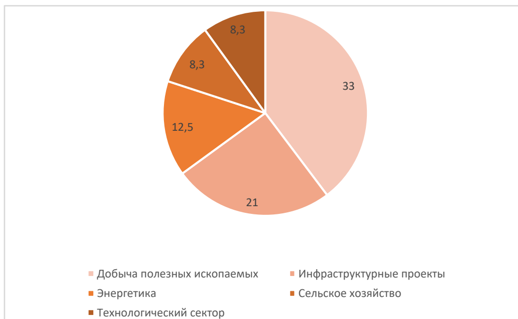
Рисунок 2 – Структура иностранных инвестиций в сектора Африканской экономики 2021 г., млрд долл.

Секторальная структура иностранных инвестиций в Африке остается относительно стабильной, однако в последние годы наблюдается рост интереса к новым отраслям.