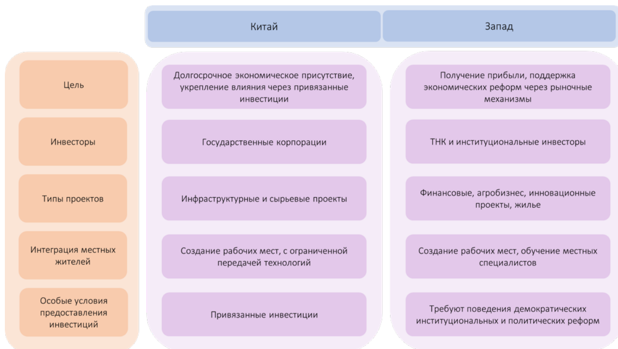
Рисунок 3 – Сравнение Китайской и западной инвестиционной модели

демонстрирует стратегию, ориентированную на долгосрочное партнерство с Африкой, без жестких политических условий, но с экономическими обязательствами.