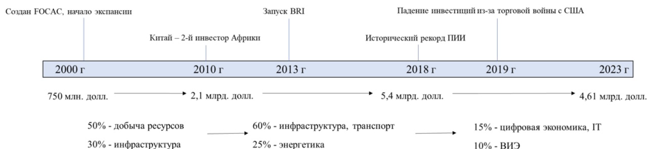
Рисунок 4 – Основные этапы развития китайских инвестиций в Африке

Хотя суть механизма зависимости остается неизменной, стратегия Китая эволюционирует, отражая смену его приоритетов.