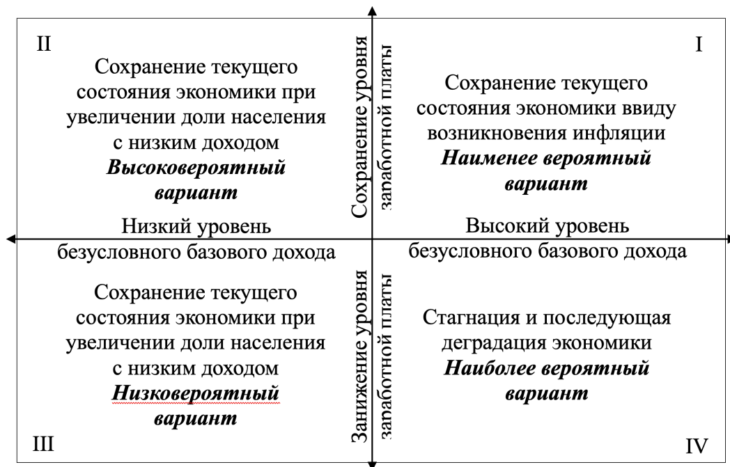
Рисунок 1 – Сценарии введения безусловного базового дохода

например, работающих неполный рабочий день) с самым низким уровнем дохода, или сокращения рабочего времени их и других категорий занятых. И такая тенденция уже нашла своё отражение в рамках реализации безусловных выплат на Аляске, где число занятых в целом по штату не показало каких-либо изменений, при этом увеличилась доля работников, занятых неполный рабочий день, на 1,8 процентных пункта (или на 17%) по сравнению с периодом до введения безусловных трансфертов. Однако ощутимого влияния на макроэкономическую обстановку в регионе это не оказало ввиду незначительности такой динамики [52].