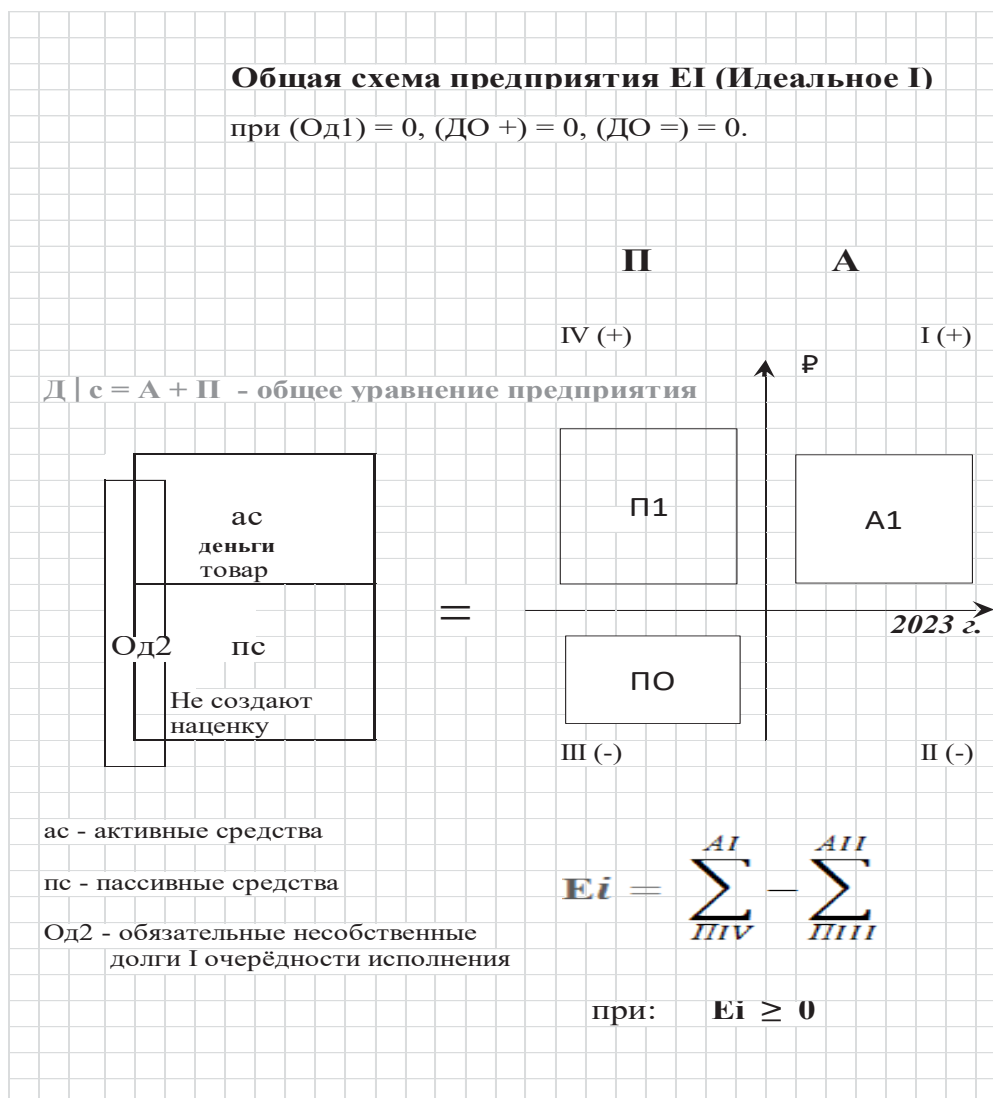
Рисунок 1 – Общее изображение ресурсов и аналитическое представление коммерческих предприятий, относимых к предприятию ЕІ «Идеальное І»

исполнения (судебные экономические решения в свою пользу или Од1), но на рисунках, при их отсутствии, такие долги для упрощения не показываются.