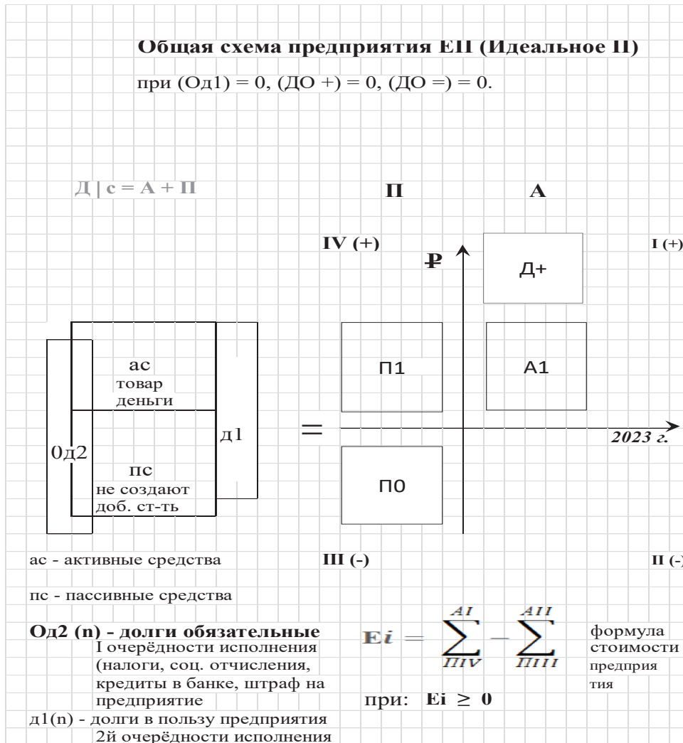
Рисунок 3 – Общее изображение ресурсов и аналитическое представление коммерческих предприятий, относимых к предприятию Е П «Идеальное П»

На общей схеме (рис. 3) условно показано такое предприятие.