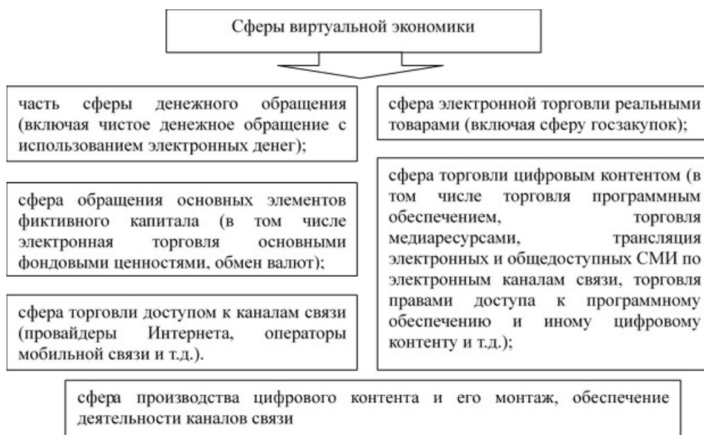
Рисунок 2 – Основные сферы виртуальной экономики