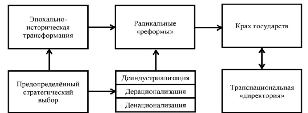
Рисунок 1 – Взаимообусловленность процессов установления транснационального диктата

В итоге неолиберальные, а точнее постмодернистские «шаблоны» перестают опираться на общественные (общенациональные) экономические интересы и уничтожают и субъектность и подлинность, то есть приводят к не только виртуальному структурному реформированию системы на стадии практически пикового спада и разрушения, но и формируют ресурс её недопустимой и вопиющей мутации и кардинальной «перелицовки». Финальная цель ясна, как бы это конспирологически не представлялось и не звучало - конструирование нового «дивного мира» - «новой нормальности» с единым мировым правительством («директорией») (рис. 1).