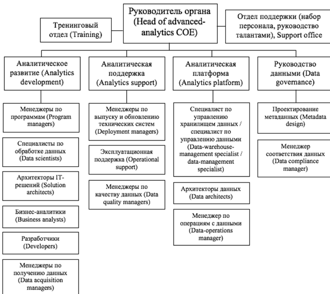
Рисунок 1 – Типовая организационная структура подразделения «Центр расширенной аналитики передового опыта», используемая наиболее эффективными компаниями [19]

плоскости систематизации и рассмотрения различных точек зрения отечественных исследователей, а также последующего указания ключевых этапов проведения аналитических мероприятия, особенностей организации анализа и обобщение сформулированной методики в виде блок-схемы.