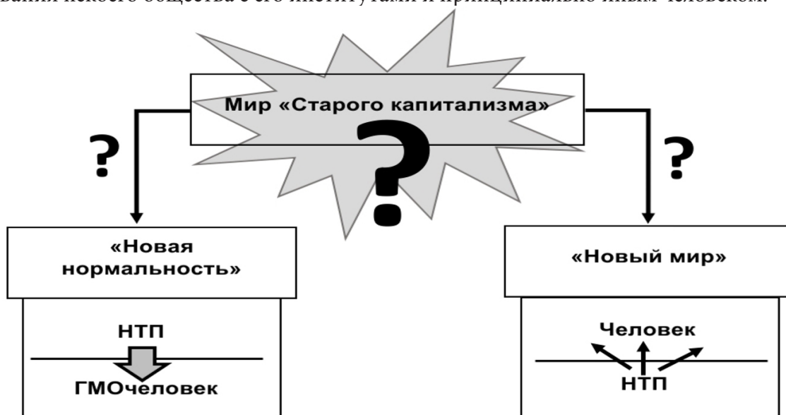
Рисунок 1. Проблемный вопрос «старого мира».

Гордиев узел мира «старого капитализма» разрубить в настоящие времена представляется не столь сложным. К тому же, сценарии разрешения этой проблемы уже прописаны и не без успеха реализуются. И авторы, и исполнители этих сценариев, адепты «новой нормальности» К. Шваба имеют представление о преходящем характере не только фактической системы «старого капитализма», но и той его переходной стадии, которая следует за ним сегодня. Сейчас на повестке – новая, малоизвестная и мало осознанная большинством модель эволюционного? (деградационного?) нестабильного формирования некоего общества с его институтами и принципиально иным человеком.